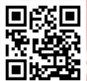
Illustration: Liana Pérez / Artwork: Association DVhttps://festivalcm.online/fr/

FACULTÉ DES LETTRES ET SCIENCES HUMAINES - BENI MELLAL CÉNTRE CULTUREL GRANDS ARBRES - BENI MELLAL MAISON DE LA CULTURE - BENI MELLAL MATERNITÉ - OUAOUZEGTH ASSOCIATION AL INTILAKA - AFOURAR